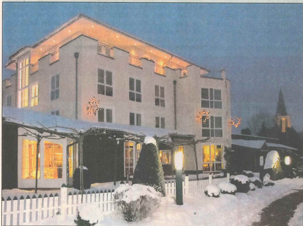
Am kommenden Sonntag wird der Neubau nun auch offiziell fertiggestellt sein und die Zimmer und Wohnungen können gebucht und bezogen werden.

Emsbüren (hp). Im Juli 2010 Einweihung des kompletten vier Ferien- und Penthouse-wohnungen buch- und beziehbar. Die großzügig bemessenen Zimmer beeindrucken durch